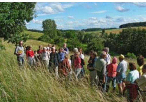
Der Natur auf der Spur