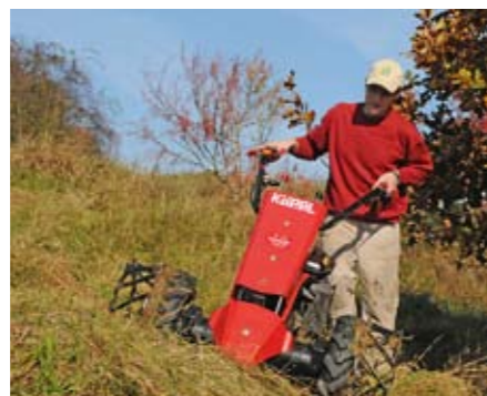
Mahd einer Hangwiese