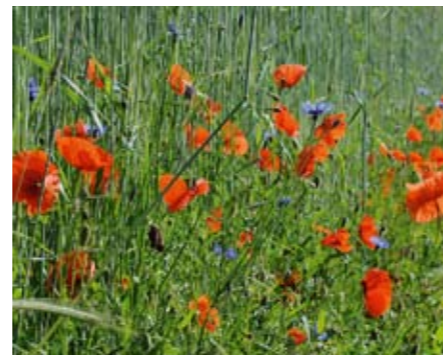
Ackersaum mit Kornblume und Klatschmohn

durchziehen sie die Landschaft wie ein Netz. Im Biotopverbund Bockerlbahn-Radweg wachsen in solchen Säumen Wegwarte, Johanniskraut und Wilde Möhre. Tierarten wie Feldgrille, Sichelschrecke und Schmetterlinge nutzen sie als Lebensräume sowie als Wanderpfade, um neue Gebiete zu erreichen.