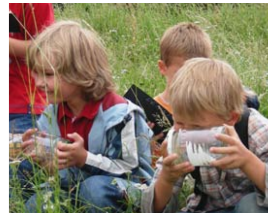
Kleine Forscher in der Wiese

der „Wilden Küche“ verarbeiten die Schüler ihre selbst gesammelten Wildkräuter zu schmackhaftem Brotaufstrich, Süßspeisen und Erfrischungsgetränken. Jugendliche porträtieren mit großer Begeisterung die entdeckten Wiesenpflanzen.