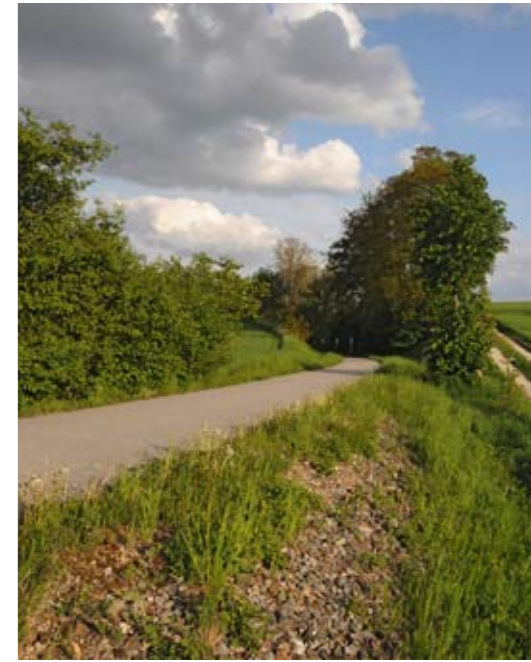
Lebensraum der Zauneidechse